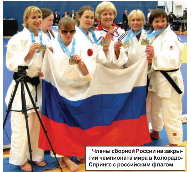
Члены сборной России на закрытии чемпионата мира в Колорадо-Спрингс с российским флагом

Что бросилось в глаза, так это отсутствие автобусов. И это в городе с населением почти в 400 тысяч человек. Автомобили и самолеты - вот основной транспорт.