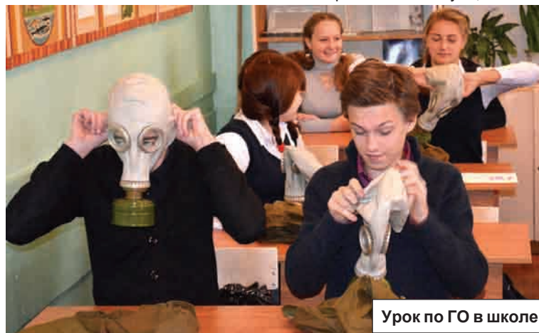
Урок по ГО в школе